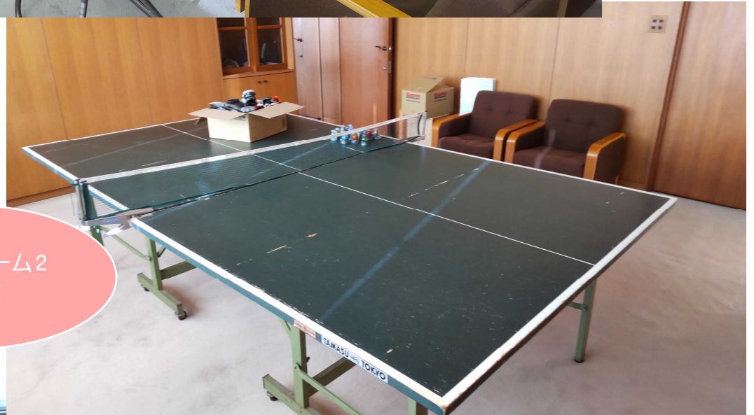
フラワーーム2 応接室