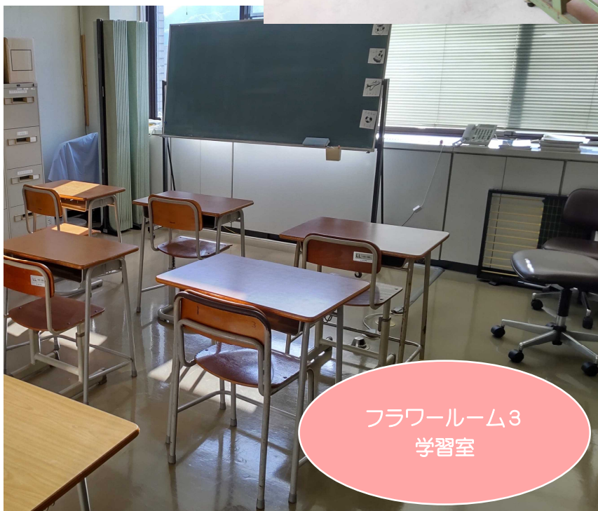
フラワーーム3 学習室

フラワーームには、3つの部屋があります。 各自で1日の過ごし方を決めてもらい、それぞれの目的にあわせて部屋を使い分けしています。