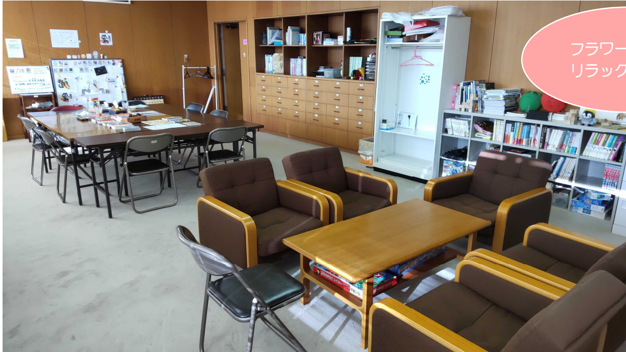
フラワーーム1 リラックスルーム