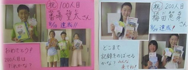
廊下へ掲示 来館 100 人目、200 人目記念