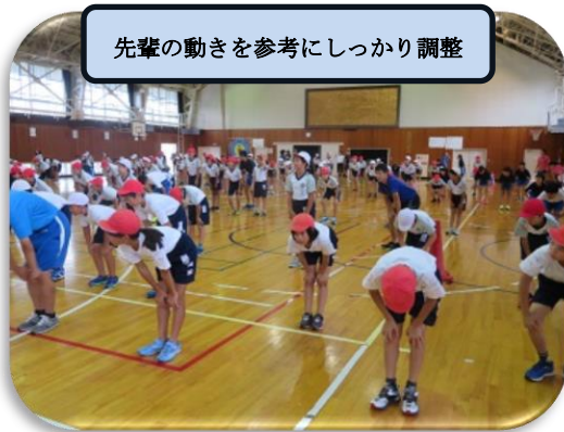
先輩の動きを参考にしっかり調整