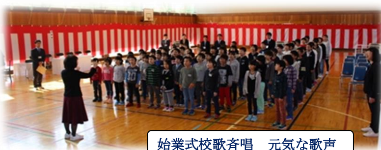
始業式校歌斉唱 元気な歌声