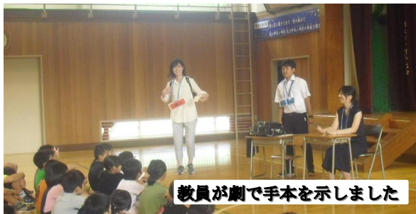
教員が劇で手本を示しました

今月の生活目標は「進んであいさつしよう」「時間を守ろう」です。2日に生活朝会が行われました。教員が児童役になって劇を行い、あいさつの大切さ、どんなところに気を付けてあいさつをしたらよいか、子どもたちに考えさせ、指導を行いました。その後、学級に戻り、子どもたちは実際にいろいろな場面を想定してあいさつ練習をしました。生活目標に学校ぐるみで取り組むことにより、伊米小のあいさつの輪を一層広げていきたいと思ひます。