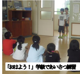
「おはよう！」学級であいさつ練習