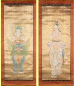
下村観山《普賢文殊》1909年頃

【展示室1】近代美術館の名品-新収蔵品を中心に-令和元年度に新しく収蔵された日本画や版画を中心に紹介します。 【展示室2】生誕110年佐藤哲三と蒲原の画家達蒲原の地に生きた佐藤哲三の作品を、仲間の画家たちの作品とともに紹介します。 【展示室3】中村忠二 詩情と激情 何気ない日常を描いた中村忠二の世界を紹介します。