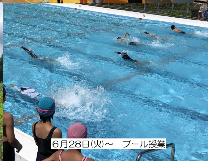
6月28日(火)～ プール授業