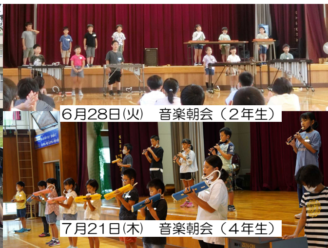
6月28日(火) 音楽朝会(2年生)