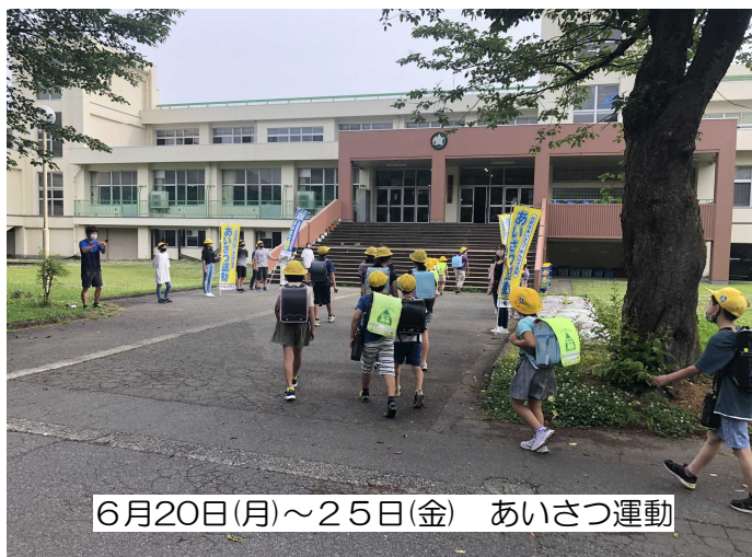
6月20日(月)～25日(金) あいさつ運動