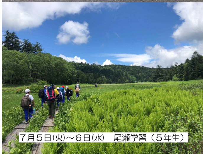
7月5日(火)～6日(水) 尾瀬学習(5年生)