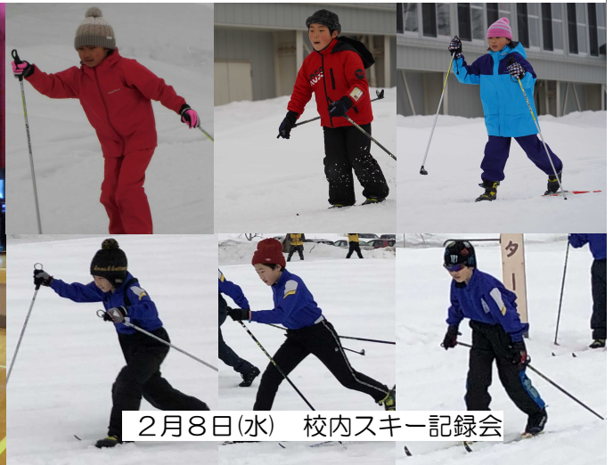
2月8日(水) 校内スキー記録会