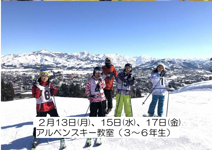
2月13日(月)、15日(水)、17日(金) アルペンスキー教室(3~6年生)