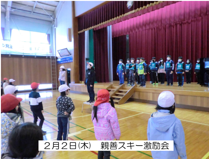
2月2日(木) 親善スキー激励会