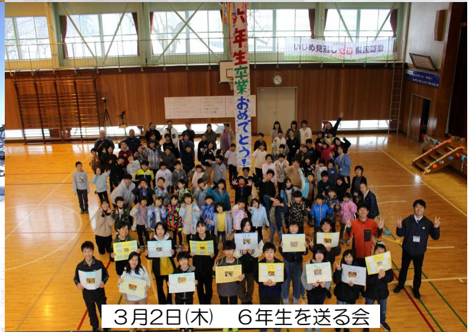
3月2日(木) 6年生を送る会