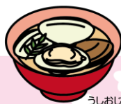
うしろの ハマグリの潮汁