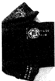
ゆるキャラクターが入った 記念ポロシャツ