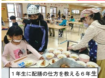
1年生に配膳の仕方を教える6年生

市内の感染状況を踏まえ、2年生から6年生は教室からリモートで入学式の様子を参観しました。入学式の呼名では、入学の喜びと希望に満ち溢れた1年生の元気のよい返事を聞くことができました。校長の話の中で、頑張ってもらいたいこととして、①元気にあいさつすること、②先生やお兄さんお姉さんの話をよく聞くことを伝えました。