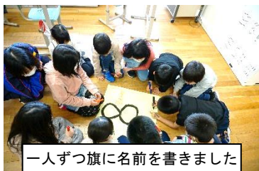
一人ずつ旗に名前を書きました

年間を通して、1年生から6年生で構成される「なかよし班（全21班）」による活動を行い、他者と関わる力を身に付けていきます。早速、6年生のリーダーシップのもと、チームのシンボルとなる旗づくりと顔合わせを行いました。今後、なかよし班ごとの遊び会など、子どもたちの自主的な活動を展開しながら仲間づくりを進めていきます。