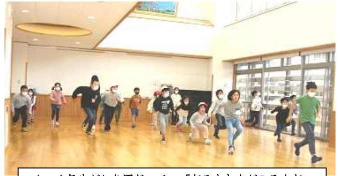
1～6年生が入り混じっての「だるまさんがころんだ」

コロナ禍により休止していたなかよし班（縦割り班）の活動を、徐々に再開しています。湯之谷小学校では清掃活動も縦割り班で行っています。上学年の子は下学年へのかかわりを通して思いやりやリーダーシップを、下学年の子はフォロワーシップを身に付ける場の一つとしてとらえています。ひと昔前は、公園や広場、学校のグラウンドなどで学年が混じって遊ぶ場面が見られたものですが、今は意図的に設定しないとなかなかそうした場面はありません。社会スポーツなども、そのひとつですね。異学年交流は、ひとつの社会でもあります。多様な人と主体的にかかわる中で、社会性を身に付けていくことを目指します。これからも、コロナの状況を見ながら、様々な活動に取り組ませていきたいと考えています。