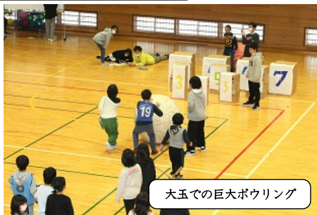
大玉での巨大ボウリング

コロナ禍の影響により活動制限を余儀なくされていた、なかよし班（縦割り班）での活動。12月22日（木）。満を持して、児童会祭り「湯之谷フェス」を開催することができました。この児童会行事は、5・6年生が委員会ごとにチャレンジコーナーを企画・運営し、4年生以下がなかよし班ごとに巡回しながら楽しむものです。4年生にとっては、初めての「プチ・リーダー体験」の場でもあります。