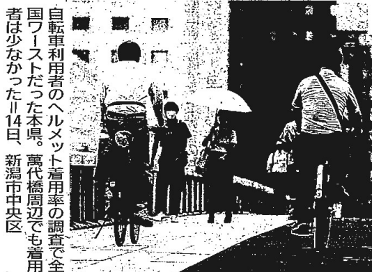
自転車利用者のヘルメット着用率の調査で全国ワーストだった本県。萬代橋周辺でも着用者は少なかった14日、新潟市中央区

4月施行の改正道交法で自転車利用者のヘルメット着用が全年齢の努力義務となり、警察当局が7月、初めて全国調査した結果、本県の着用率は2.4%と全国平均の13.5%を大きく下回って全国最低だったことが14日、警察庁のまとめで分かった。都道府県別で最高の愛媛の59.9%と、50ポイントの差があった。警察庁によると、調査は都道府県警が駐輪場のある駅前2カ所、商店街やショッピングセンター周辺2カ所の計4カ所を選び、確認した。全国で計5万2135人を調査し着用は7062人だった。本県の調査は7月7、11、18日の3日間、新潟市、長岡