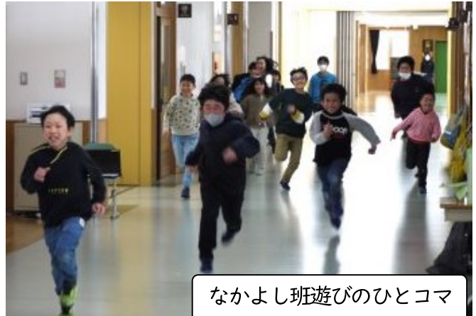
なかよし班遊びのひとコマ (異学年交流)

5・6年生で取り組んできた鼓笛隊を、新年度の4・5年生にバトンタッチする移杖式が3月1日(金)に行われました。練習の成果を発揮する場が少なくなっているのが実態ですが、湯之谷小学校の伝統を守ろうと、精一杯取り組んでいます。児童数も少なくなり、従来の編成や隊形をそのまま行うことは困難なため、少しずつアレンジしています。この日は授業参観だったこともあり、多くの保護者からもご覧いただきました。ありがとうございました。