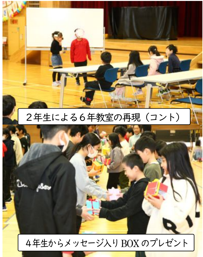
2年生による6年教室の再現（コント）

縦割り班での6年生クイズの後、いよいよ6年生の出番です。6年生は、思い出の出来事を、在校生が知らないエピソードを交えて表現。2時間を超える長丁場でしたが、温かく幸せな気持ちに包まれたひと時でした。