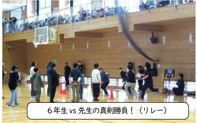
6年生 vs 先生の真剣勝負！（リレー）

5・6年生で取り組んできた鼓笛隊を、新年度の4・5年生にバトンタッチする移杖式が2月28日（金）に行われました。練習の成果を発揮する場が少なくなっているのが実態ですが、湯之谷小学校の伝統を守ろうと、精一杯取り組んでいます。児童数が少なくなり、従来の編成や隊形をそのまま行うことは困難なため、少しずつアレンジしています。この日は授業参観だったこともあり、多くの保護者からもご覧いただきました。ありがとうございました。