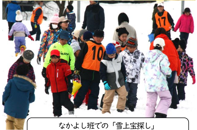
なかよし班での「雪上宝探し」